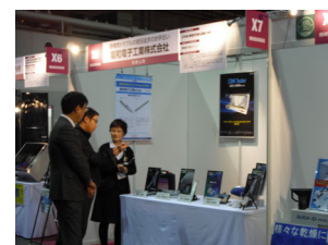
多くの方々にお立ち寄り頂きました

ない狭い場所の帯電測定を可能とした「HSK-V5000DY」、静電帯電防止服の性能確認が簡単にできる「HGC-5008」の4種製品を出展しました。今回もたくさんの方々から貴重なご意見、ご要望を頂くことができ、これからの製品改良や新製品開発に役立ててまいります。