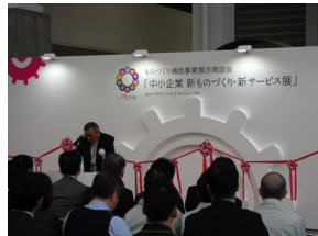
主催者代表のごあいさつ