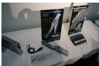
静電機可視化モニタ シリーズ