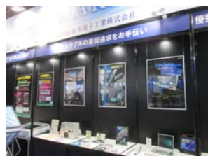
阪和電子工業ブース

その他にもオートモーティブワールド内の5展示会を始め、ウェアラブル EXPO やロボデックス、スマート