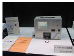
コンパクトESD試験器 HCE-5000