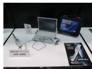
静電気が視える！を実演 静電気可視化モニタ

お陰様で多くのお客様にご来場頂き、出展製品の説明とお客様の現場ニーズに合わせたソリューション等