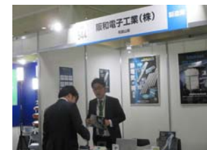
静電気が視える！を実演

弊社は、静電気の帯電状況を確認することができる「静電気可視化モニタ」のシリーズを出展しました。様々な業界の方々にご来場頂き、