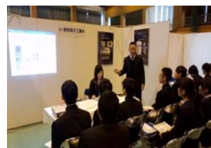
熱心に耳を傾ける学生の方々

12月16日(金)、和歌山工業高校にて開催されました企業説明会に弊社も参加しました。和歌山工業高校2年生及びそのご父兄の方々が対象。和歌山県が主催で、ものづくり(産業)立県を目指し、ものづくり企業を支える人づくり体制を構築し、優秀な人材を育成し、