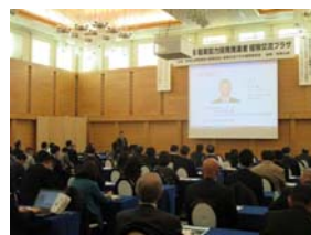
多くの方々にご聴講頂きました

12月7日(水)、和歌山市内のホテル アバローム紀の国で開催されました企業の教育訓練担当者の勉強会「和歌山県職業能力開発推進者経験交流プラザ」(和歌