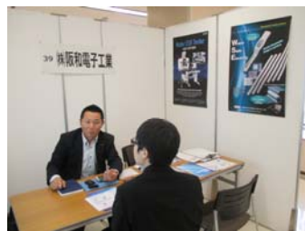
学生の方々と活発に情報交換