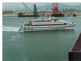
フェリーで快適移動

深圳は、香港との国境付近にある都市で、香港空港からは列車やバスなどで1時間程の所です。今回、深圳までの渡航は、中国への入国手続きが簡単に行えるフェリーを利用しました。