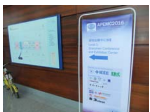
会場のあちらこちらに案内板

深圳は、香港との国境付近にある都市で、香港空港からは列車やバスなどで1時間程の所です。今回、深圳までの渡航は、中国への入国手続きが簡単に行えるフェリーを利用しました。