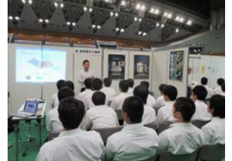
熱心に耳を傾ける学生の方々

県内で採用を予定している企業108社、就職希望の高校3年生約2,300名及びご父兄の方々が参加し行われました。会場全体は、すごい熱気に包まれ、各企業の担当者は熱く自社を語り、また、学生の方々は自分の想いや質問を積極的に企業担当者につけ、非常に活気ある合同企業説明会でした。