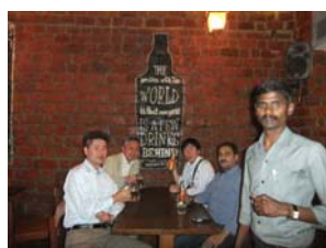
一仕事を終えた後の一杯は最高！

インドでは野良牛や野良豚が多く、幹線道路の真ん中で寝そべっている光景がよく見ると聞いていたのですが、私が訪問したバンガロールでは全くそのような光景が見られませんでした。バンガロールは、IT産業エリアで、インド国内で最も近代的な都市。これからの発展に期待です。