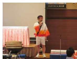
懇親会であいさつする長谷部社長