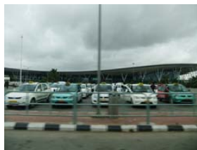
バンガロール空港

➤ 翌日、お客様の所に行く途中、市街地を通ったのですが、車やバイクが多く大渋滞していました。そこで、日本では見ることが出来ない、人力車をもじったと言われる「リキシャ」と呼ばれる乗合タクシーを目にしました。出張中、機会がありこれに乗車したのですが、三輪式に加えサスペンションが貧弱で、また、郊外の道路事情が悪いのも重なり非常に乗り心地が悪かったです。