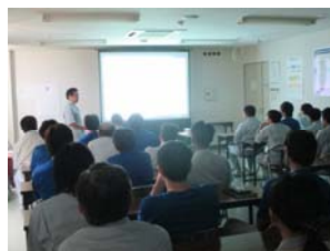
経営方針発表会の様子

8月3日(月)、社内で経営方針発表会を行いました。弊社は、8月が新年度スタートになり、今期が第40期目。社長の長谷部から今期の経営方針を発表後、各部門長より部門方針の発表を行いました。全社一丸となって、継続的な改善を行い、より良い製品をご提供できるよう努めてまいります。