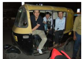
弊社メンバーと記念撮影

インドの食事といえばカレーが定番ですが、日本のカレーライスに非常に近い味付けのものがあつたり、ヨーグルト風味やカレーパンのようなものまで、カレーといっても一言では言い表せないくらい種類が非常に豊富だったことに驚かされました。➤裏面に続く