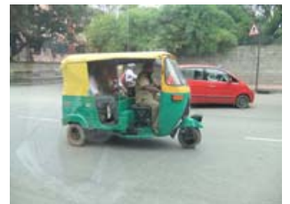
乗合タクシー「リキシャ」

➤ 翌日、お客様の所に行く途中、市街地を通ったのですが、車やバイクが多く大渋滞していました。そこで、日本では見ることが出来ない、人力車をもじったと言われる「リキシャ」と呼ばれる乗合タクシーを目にしました。出張中、機会がありこれに乗車したのですが、三輪式に加えサスペンションが貧弱で、また、郊外の道路事情が悪いのも重なり非常に乗り心地が悪かったです。