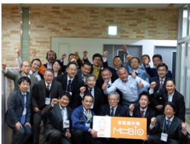
「MOBIO-Café Meeting」参加者で集合写真

を行いました。多くの異業種の皆様と出会い、技術的な質問や使用事例の提案など活発な意見交換を行うことができました。