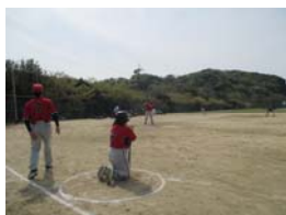
時にはナイスプレー、時にはナイスバッティング、大盛り上がり!

THUNDER-BIRDS』は、1回戦 シマ ナイスミドル(株島精機製作所)と対戦し、4-24と大敗。次の秋季大会に向け、出直しです。