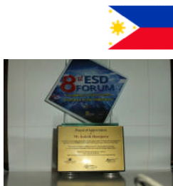
頂いたトロフィー

質疑応答の時間が設けられ、活発な情報交換を行いました。また、発表者には名前が入った立派なトロフィーが主催者から贈られ、大変貴重な体験をさせて頂きました。