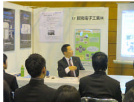
会社説明をする西出部長代理

このような学生の方々との交流イベント、企業側の我々も大変刺激になり、これからも積極的に参加していきたいと考えております。