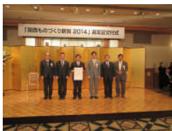
2014年2月 関西ものづくり新撰 選定式