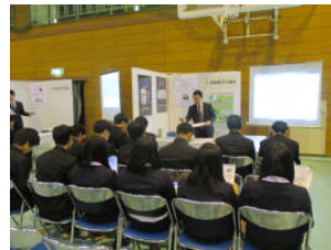
真剣に耳を傾ける学生の方々

11月12日(水)、和歌山市内にある和歌山工業高校でわかやま産業を支える人づくりプロジェクト・校友会「企業説明会」が開催され、弊社も参加しました。今回行われた「企業説明会」は、和歌山工業高校2年生400名及びそのご父兄の方々と担当教員の方々等が対象。和歌山県が主催で、ものづくり(産業)立県を目指し、ものづくり企業を支える人づくり体制を構築、優秀な人材を育成し、県内企業への就職を促進していくのが狙い。参加した学生の方々は皆、真剣に話を聞き、後の質疑応答の際は鋭い質問をたくさん頂きました。