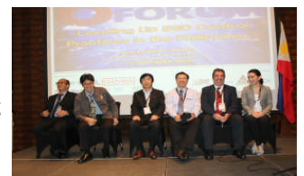
プレゼンメンバー