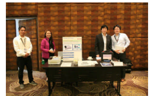
弊社ブーススタッフ

組立工程の静電気に関する品質管理の取り組みが重要視されていると事前に伺ってましたので、弊社ブースは簡易型のESDテストと静電気を