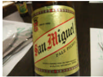
フィリピン料理とビールは最高！